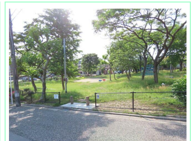
青山公園すぐ近く

※この図面はATBBの物件情報の一部を抜粋して掲載しております。(現況優先) ※入居日・引渡日変更や付帯条件、別途料金が発生する場合がありますのでご確認ください。