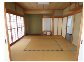
1階リビング隣の和室8帖