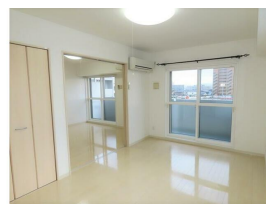
明るく広いリビング♪